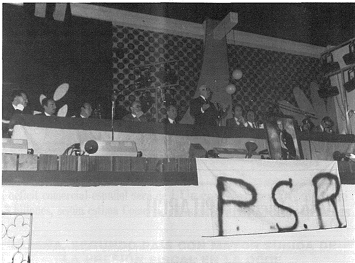
Presidencia del acto celebrado en la ciudad de Torrente (Valencia), por el Partido Social Regionalista (PSR).

EL REGIONALISMO ES EL MEJOR SISTEMA PARA SOLUCIONAR LOS GRAVES PROBLEMAS DE LA NACION/